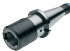
Gewindeschneid-Schnellwechselfutter mit Längenausgleich auf Druck und Zug Quick change tapping chucks with length compensation on compression and expansion Mandrins de taraudage à changement rapide avec compensation longitudinale à la compression et traction