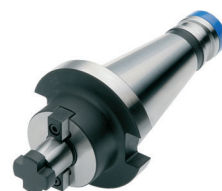
Quernut-Aufsteckfräserdorne DIN 6357 mit vergrößerter Anlagefläche Shell mill holders DIN 6357 with enlarged contact face Porte-fraises à trou lisse DIN 6357 avec face de contact élargie

* Mit Mitnehmerausfräsung nach DIN 2201 * With driving facilities according to DIN 2201 * Avec fraisage d'entraînement selon DIN 2201