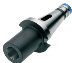
Zwischenhülse für MK mit Austreibblappen DIN 6383 Adaptor sleeves for MT with tang DIN 6383 Douilles de réduction pour CM à tenon DIN 6383

DIN 2080 \nearrow \leq 0,005 G6,3 15.000 min -1