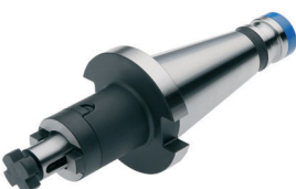
Kombi-Aufsteckfräserdorne DIN 6358 Combi shell mill holders DIN 6358 Porte-fraises à double usage DIN 6358

DIN 2080 \nearrow \leq 0,005 G6,3 15.000 min -1