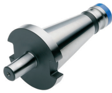
Bohrfutteraufnahmen DIN 238 Drill chuck adaptors DIN 238 Arbres pour mandrins de perçage DIN 238