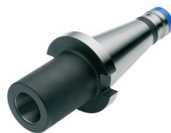
Zwischenhülse für MK mit Anzugsgewinde DIN 6364 Adaptor sleeves for MT with drawbar thread DIN 6364 Douilles de réduction pour CM avec filetage DIN 6364

DIN 2080 \nearrow \leq 0,005 G6,3 15.000 min -1