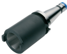
Zwischenhülsen für SK-Aufnahmen Adaptor sleeves for ISO-toolholders Douilles de réduction pour porte-outils ISO/SA