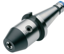
CNC-Bohrfutter für Rechts- und Linkslauf CNC-Drill chucks for clockwise and counter clockwise rotation Mandrins de perçage CNC pour rotation droite-gauche